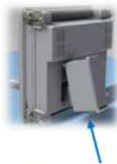
módulo (s) "EXP"

Posibilidad de expansión con módulos serie EXP (aumento pasos, salidas, puertos de comunicación) Display con iconos retroiluminado Puerto óptico de programación, descarga datos y diagnóstico Entrada de medida de tensión independiente Protección de sobrecarga de condensadores Sensor de medida de temperatura interna del cuadro Medida de armónicos en tensión y corriente Alarmas configurables Empleo en sistemas de media tensión