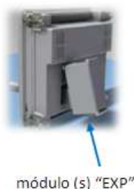
módulo (s) "EXP"

Posibilidad de expansión con módulos serie EXP (aumento pasos, salidas, puertos de comunicación) Display con iconos retroiluminado Puerto óptico de programación, descarga datos y diagnóstico Entrada de medida de tensión independiente Protección de sobrecarga de condensadores Sensor de medida de temperatura interna del cuadro Medida de armónicos en tensión y corriente hasta el 15° Alarmas configurables Empleo en sistemas de media tensión Compacto, de fácil instalación.